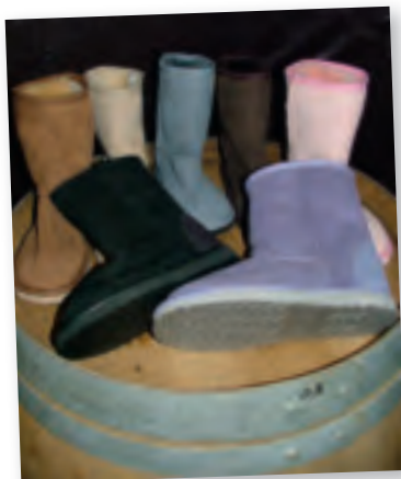
Blue Mountains UGG Boots Short Surf Boots. Ægte Australsk lammeskind. Fines i 7 farver. Pris 795 kr. www.bamsestovler.dk