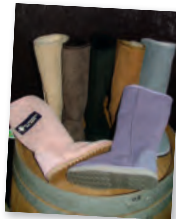
Blue Mountains UGG Boots Long Surf Boots. Ægte Australsk lammeskind. Fines i 7 farver. Pris 995 kr. www.bamsestovler.dk

Hvad enten du er til de varme bamsestøvler eller de lidt mere klassiske, finder du det bedste udvalg her.