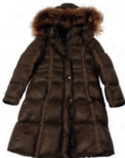
Ver de Terre Let & varm frakke m. gåsedun og aftagelig pels på hæften, til kr. 1495,-