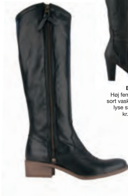
Billi Bi Super smart flad støvle i sort blankt skind med udvendig lynlås til kr. 1800,-