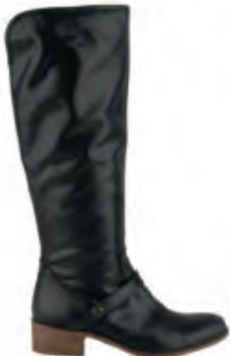
Billi Bi Lækker flad støvle i firbensskind til kr. 1800,-