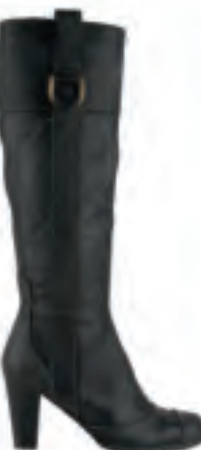
Billi Bi Høj feminin støvle i sort vasket skind med lyse stikninger til kr. 1900,-