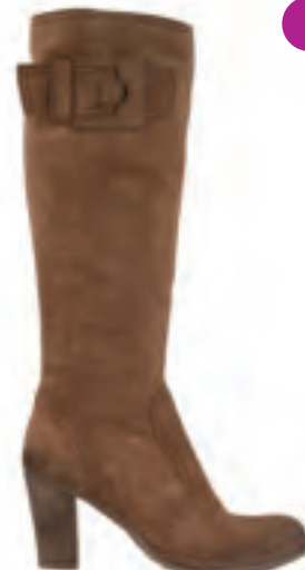
Billi Bi Rå camelfarvet støvle i slidt ruskind til kr. 1800,-